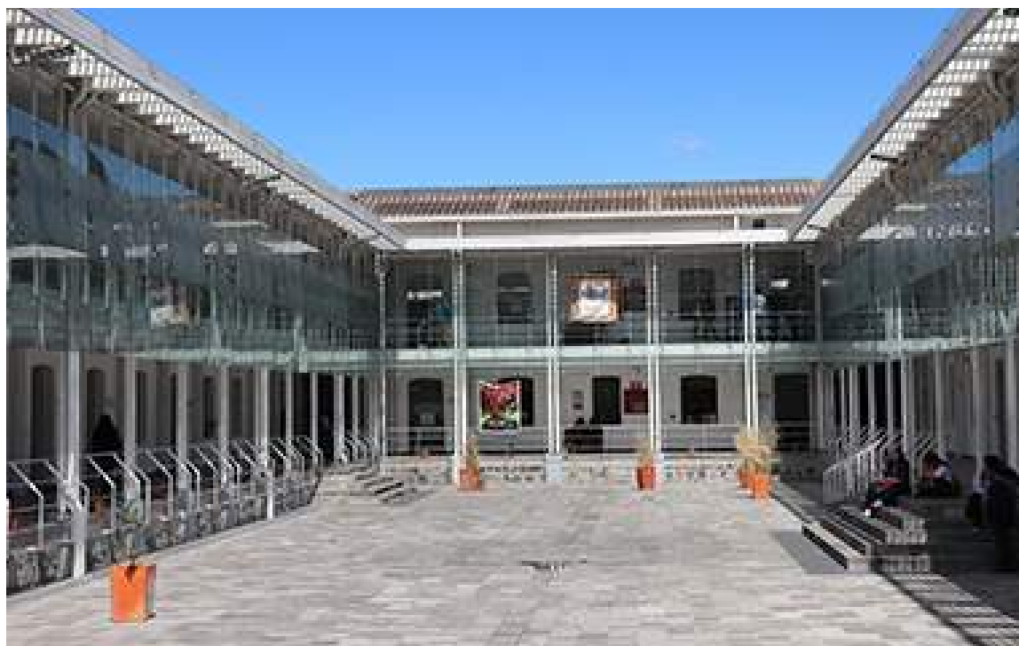
Foto 1. Campus del Instituto Yavirac