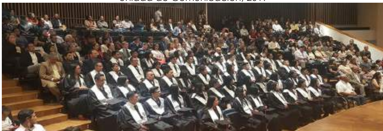
Foto 22 Promoción de graduados 2019