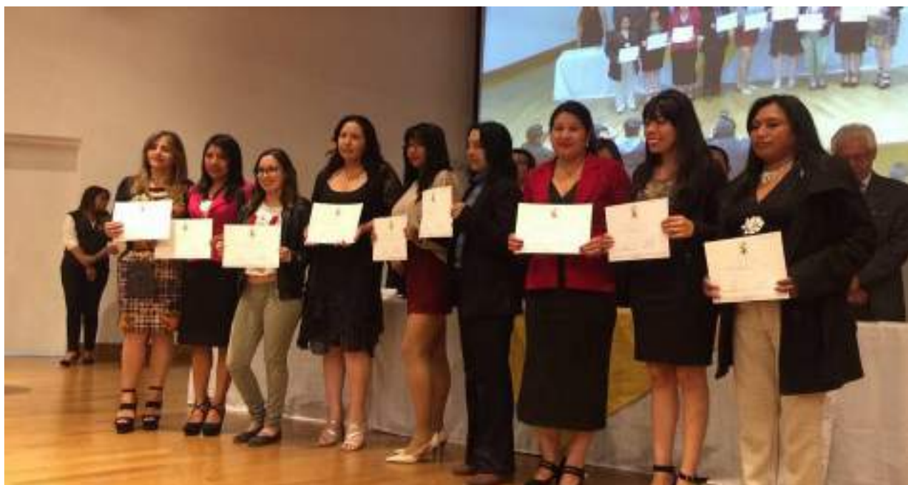
Foto 29 Entrega de certificados cursos impartidos Unidad de Comunicación, 2019