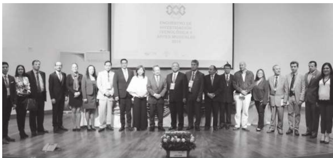
Autoridades de la Educación Superior y Auspiciantes del Encuentro de Investigación Tecnológica y Artes Musicales, en el evento inaugural el 11 de abril del 2019

Foto 30 Autoridades participantes del Encuentro de Investigación Tecnológica y Artes Musicales 2019 Unidad de Comunicación, 2019