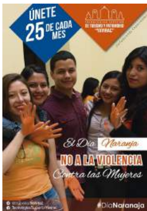
Foto 12 Actividades para difundir del Día Naranja Yavirac. Unidad de Comunicación, 2019