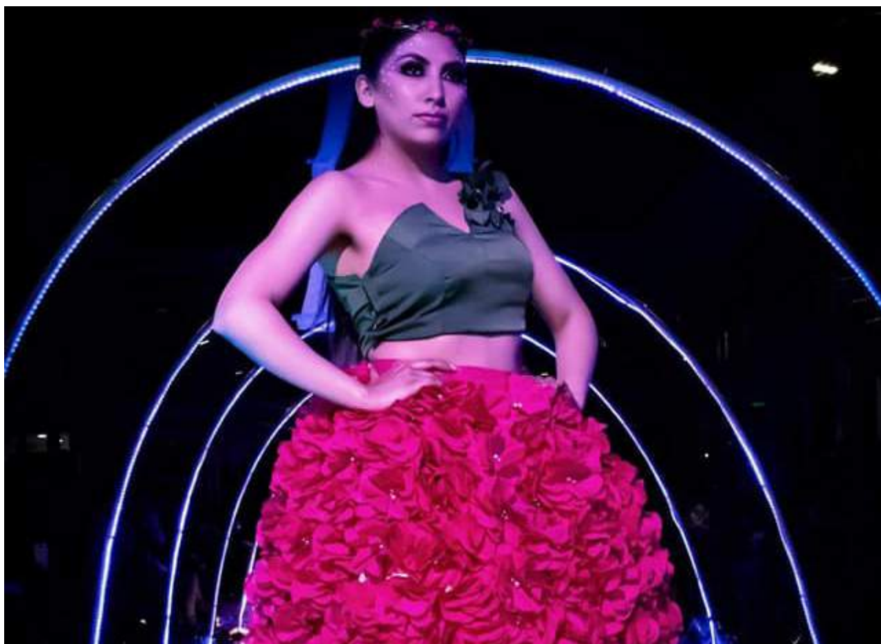
Foto 18 Escenario Gala Cultural Ñucanchipac Unidad de Comunicación, 2019