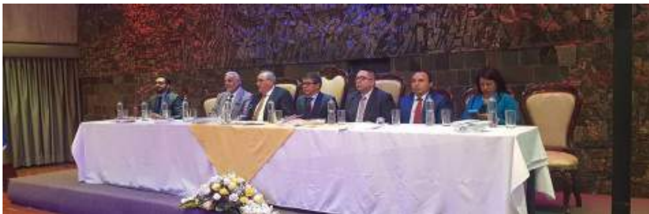
Foto 24 Mesa de autoridades Sesión Solemne Yavirac Unidad de Comunicación, 2019

Para el Yavirac es el momento de reconocer a sus docentes, sus acciones positivas dentro de la institución durante el periodo, así se ha determinados reconocimientos por años de servicio, reconocimientos a los docentes que se han obtenido grados académicos superiores y reconocimientos especiales por acciones positivas.