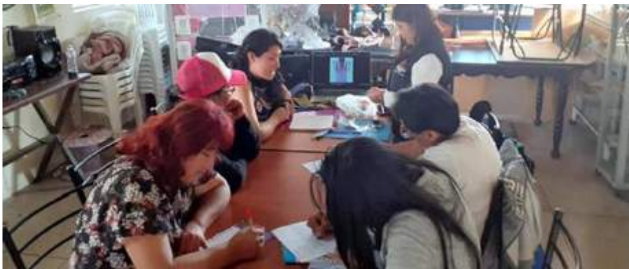
Foto 32 Estudiantes participantes del taller de bisutería Unidad de Comunicación, 2019

Se impartió por parte de las alumnas de la Carrera de Tecnología en Diseño de modas el Taller de elaboración de Bisutería.