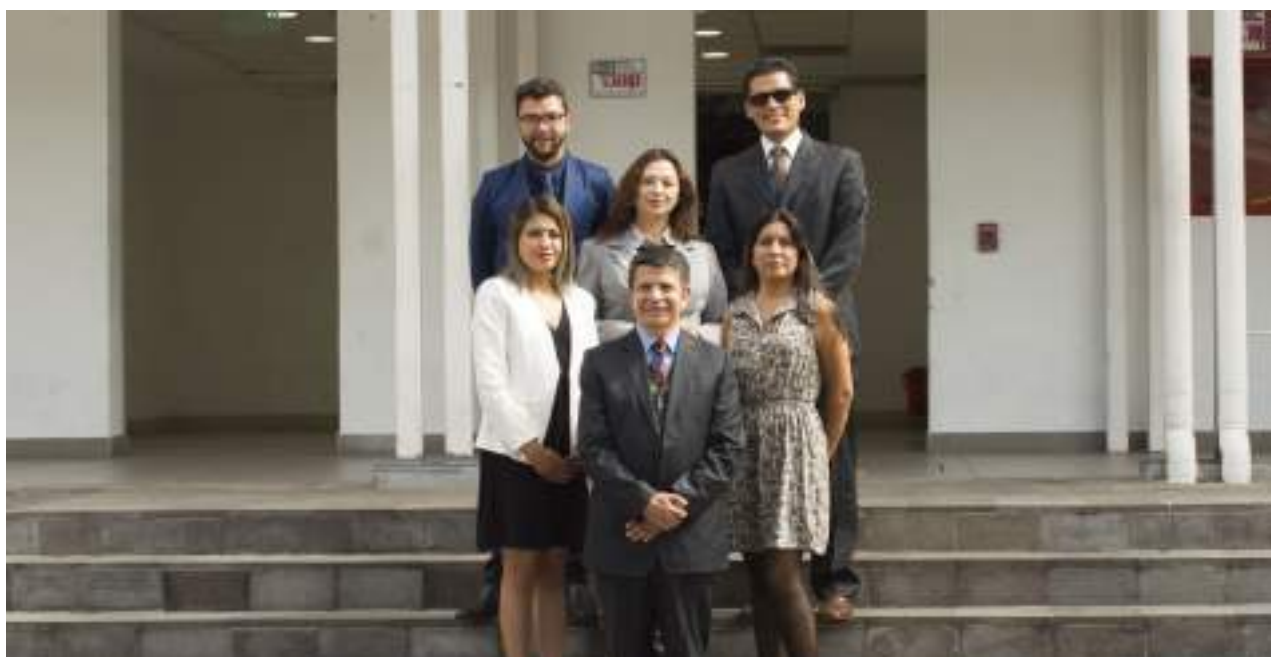
Foto 34 Equipo docente Centro de Capacitación Continua Unidad de Comunicación, 2019

Logros institucionales en Centro de Capacitación Continua.