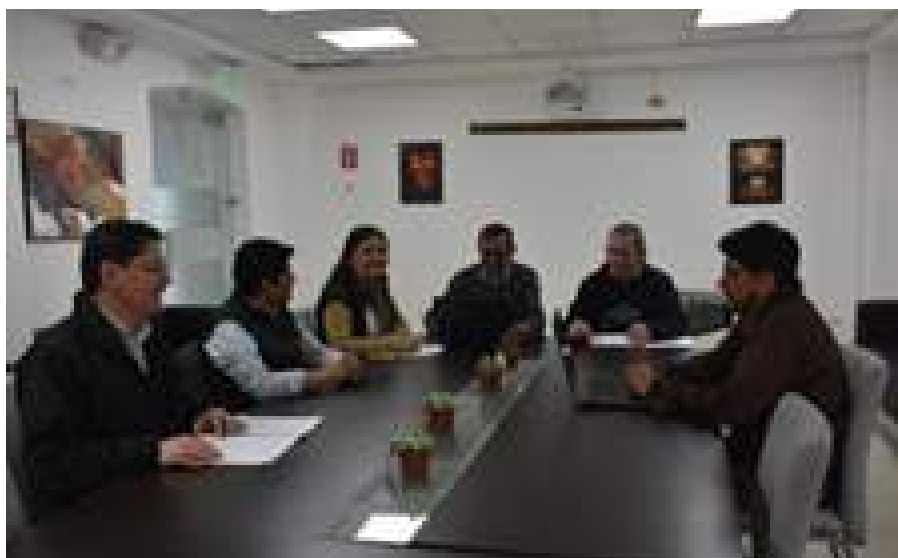
Foto 37 Equipo de la Coordinación de Planificación Estratégica Unidad de Comunicación, 2019

El equipo de planificación estratégica articuló y gestionó el desarrollo de las mesas de trabajo para la elaboración de los POAS institucionales de las áreas sustantivas de la institución.