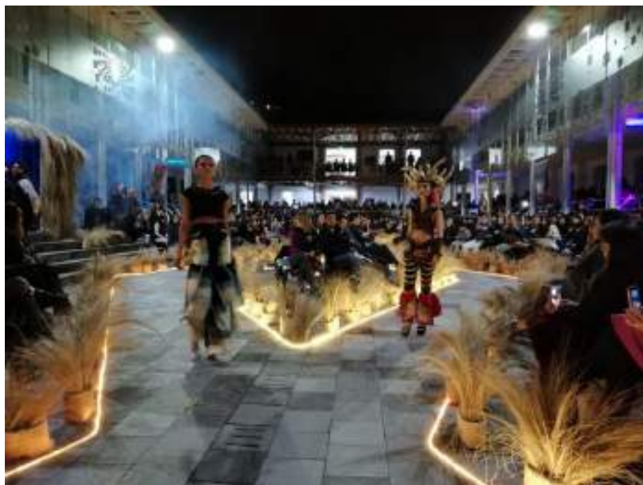
Foto 7 Trajes presentados en la Gala Cultural Qhapac Ñan segunda edición Unidad de Comunicación, 2019