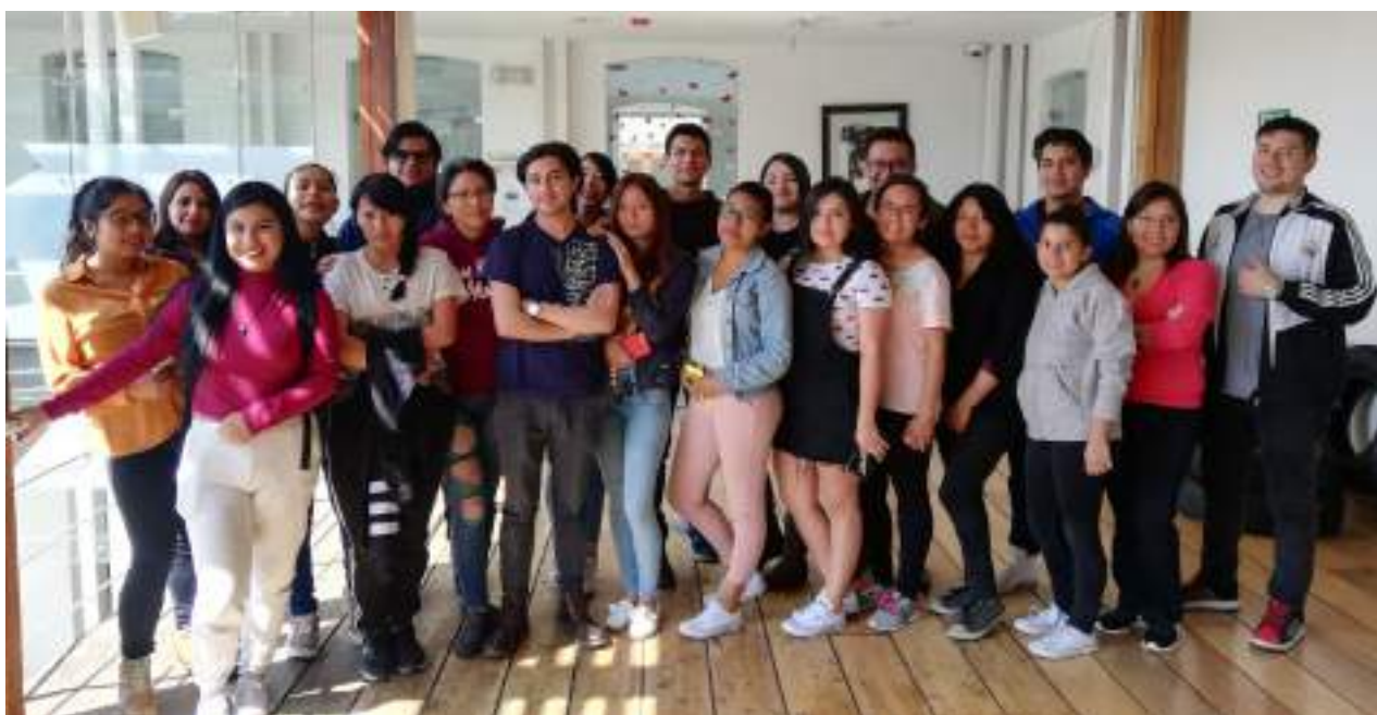
Foto 35 Cursos que se ofertan en el Centro de Capacitación Continua Unidad de Comunicación, 2019