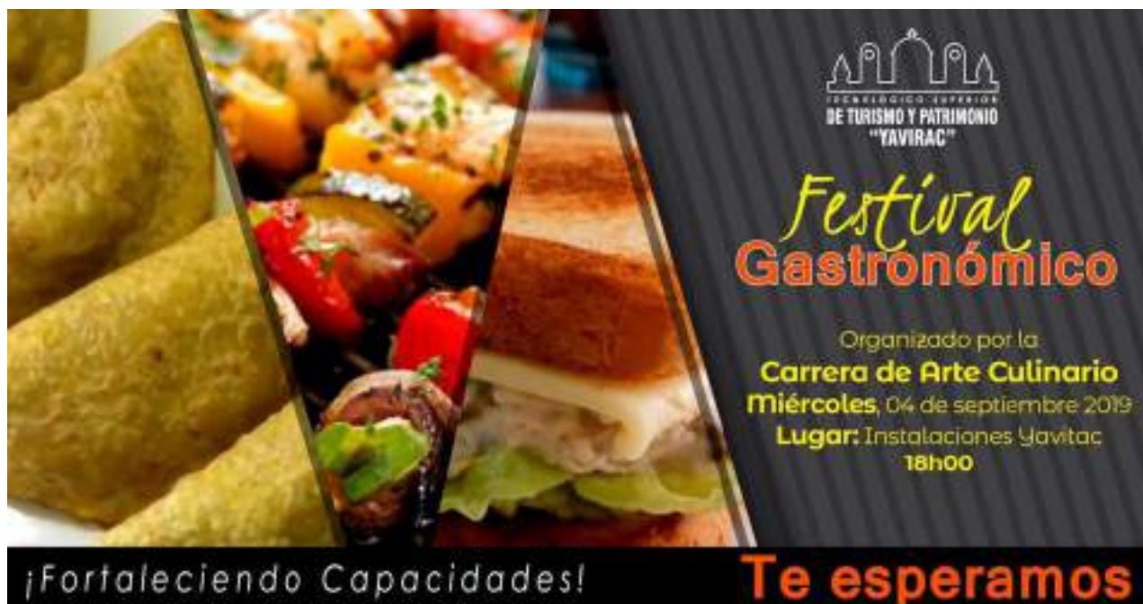
Foto 20 Festival Gastronómica, 2019

Un espacio más para demostrar las destrezas y conocimientos adquiridos por nuestros estudiantes. Así nace el Festival Gastronómico, que se presenta dentro de las festividades institucionales.