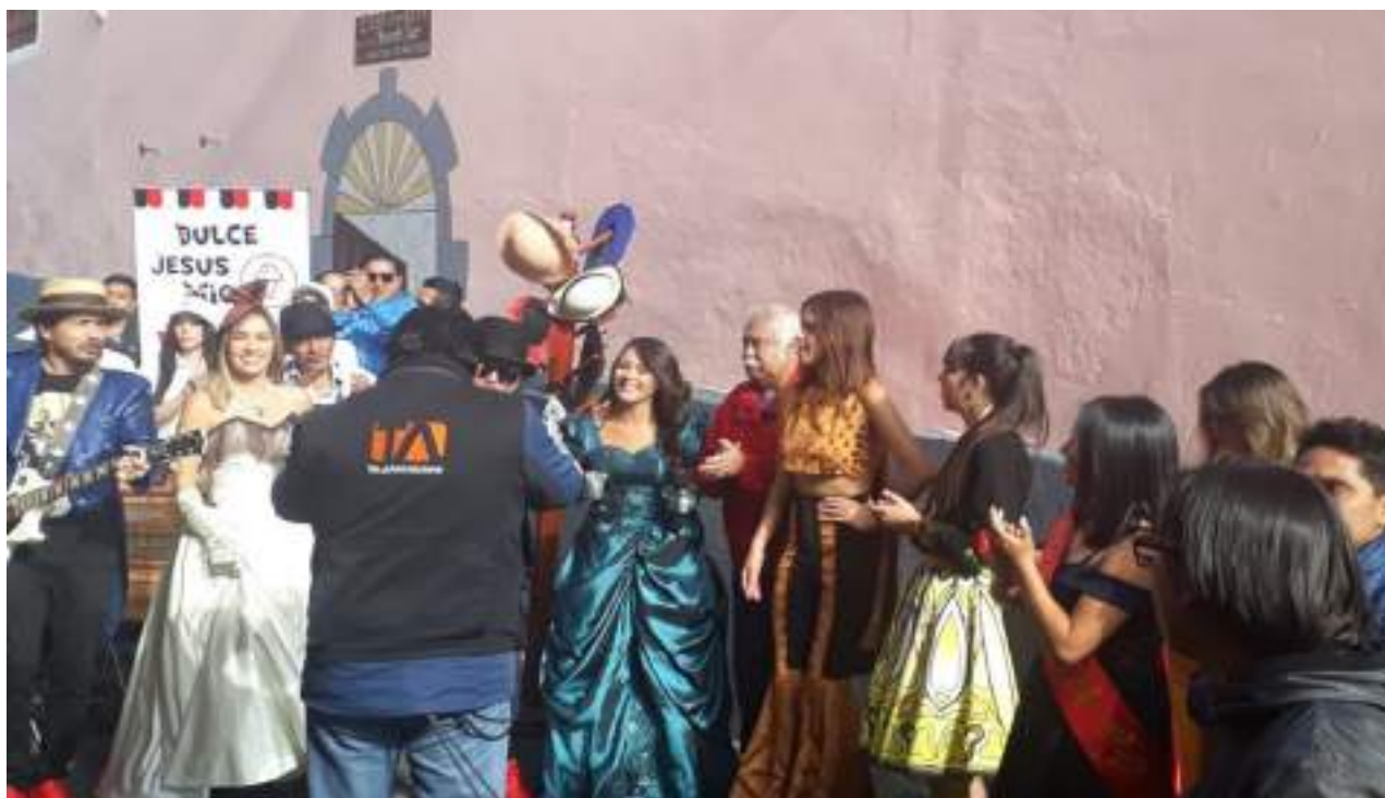
Foto 28 Fiestas de Quito, Barrio La Ronda, el barrio mas chulla de Quito Unidad de Comunicación, 2019