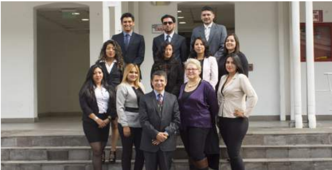
Foto 36 Equipo docente Yavirac English Center Unidad de Comunicación, 2019