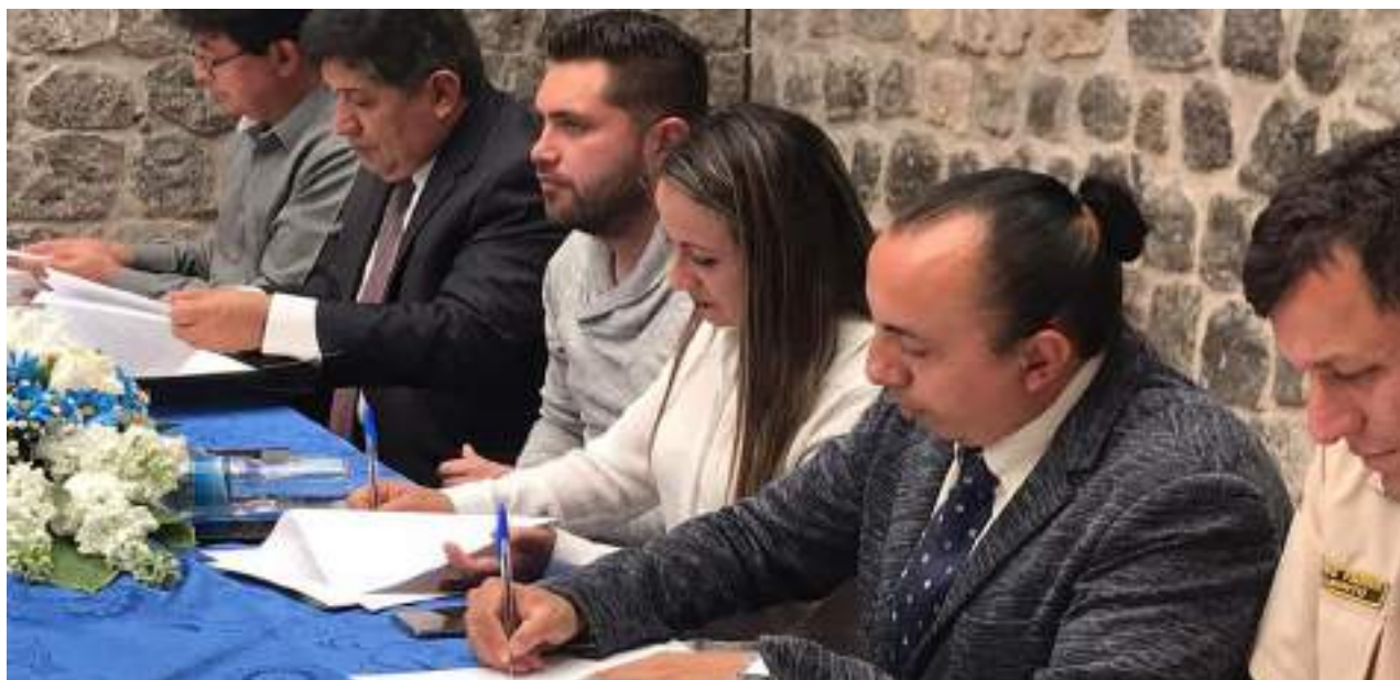
Foto 26 Firma de Convenio constitución Red gastronómica Reding. Unidad de Comunicación, 2019

Entre los institutos superiores tecnológicos: Luis A. Martínez Agronómico de Ambato, Oscar Efrén Reyes de Baños, Tsáchila y Calazacón de Santo Domingo de los Tsáchilas, Vicente León de Latacunga y De turismo y patrimonio Yavirac de Quito, las redes se constituyen como un escenario de cooperación, intercambio de conocimientos e investigaciones.