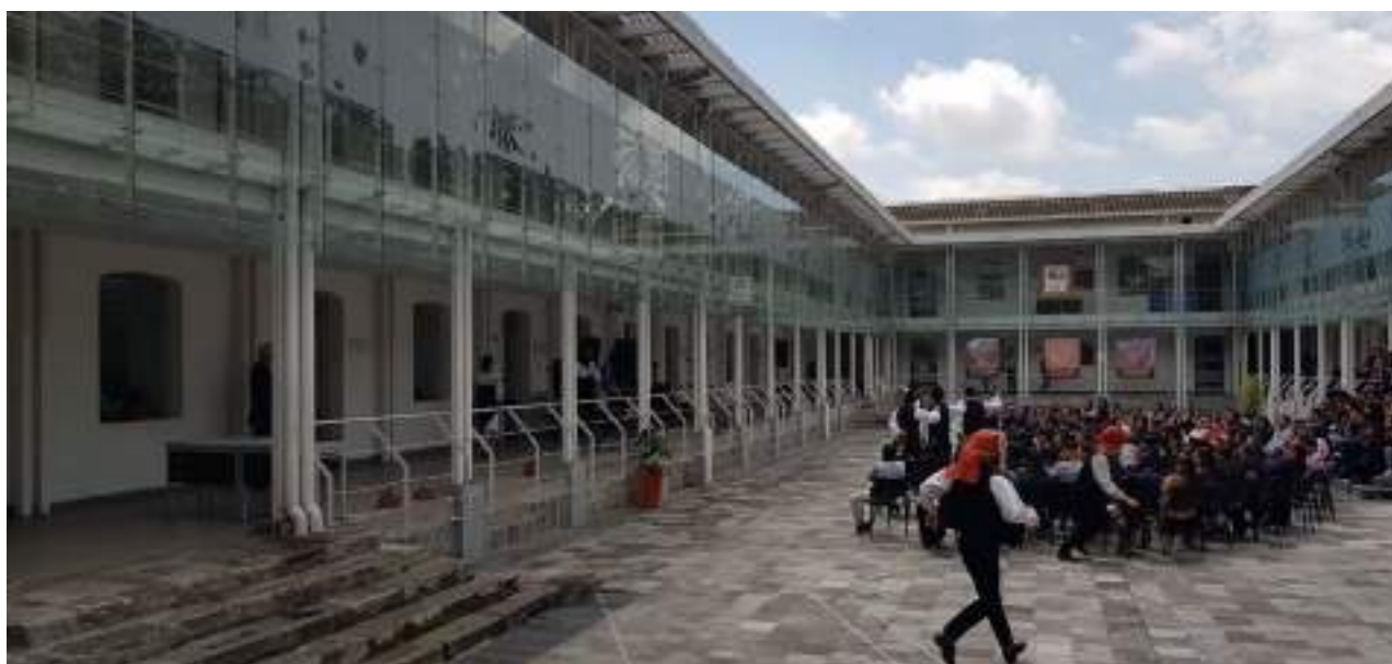
Foto 3 Conjunto Tradicional Húngaro Kákics, Unidad de comunicación, 2019