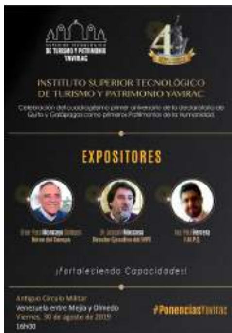
Foto 19 Invitación Preludio institucional Unidad de Comunicación, 2019