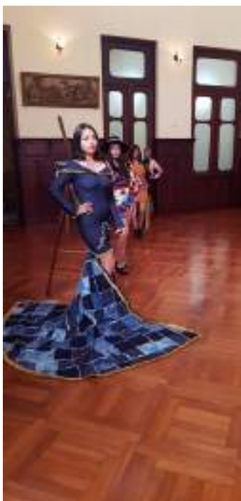
Foto 11 Trajes diseñados por estudiantes de la carrera de Tecnología Diseño de Modas Unidad de Comunicación, 2019