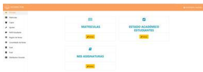
Foto 38 Pantalla principal del sistema de gestión académica Unidad de Comunicación, 2019

El equipo de profesionales de software han desarrollado el Sistema de Gestión Académica denominado Ignug, mismo que permite realizar la matrícula en línea, gestionar listas de matriculados, gestionar las notas académicas y que en la siguiente etapa presentará los record académicos de nuestros estudiantes.