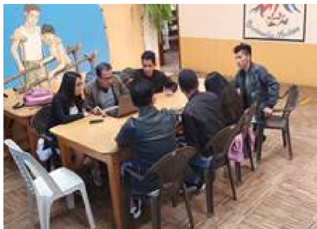
Foto 33 Estudiantes realizando sus actividades de vinculación social Unidad de Comunicación, 2019