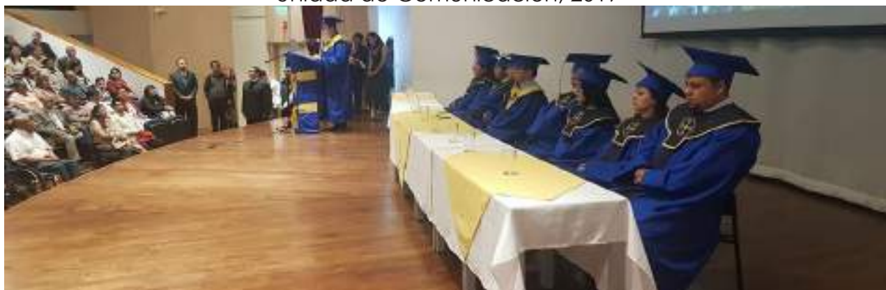
Foto 23 Autoridades académicas del instituto, graduación 2019 Unidad de Comunicación, 2019