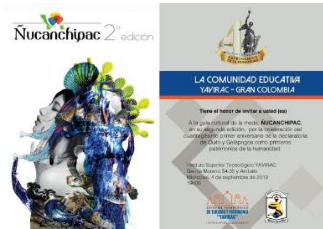
Foto 14 Presentación de diseños Gala Cultural Ñucanchipac Unidad de Comunicación, 2019

Las Galas Culturales de la Moda tienen dos fechas especiales para presentar los trabajos de los estudiantes de la Tecnología de Diseño de Modas, marzo y septiembre son los meses elegidos para estas presentaciones.