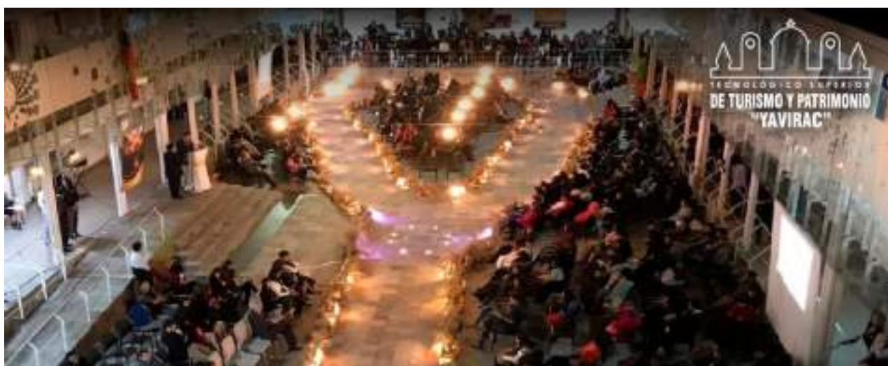
Foto 15 Escenario Gala Cultural Qhapac Ñan Unidad de Comunicación, 2019

Los escenarios en los que se presentan, son un reto para docentes y estudiantes de la misma carrera y de otras carreras como Sistemas, Electrónica y Electricidad, dando a los asistentes una noche espectacular.