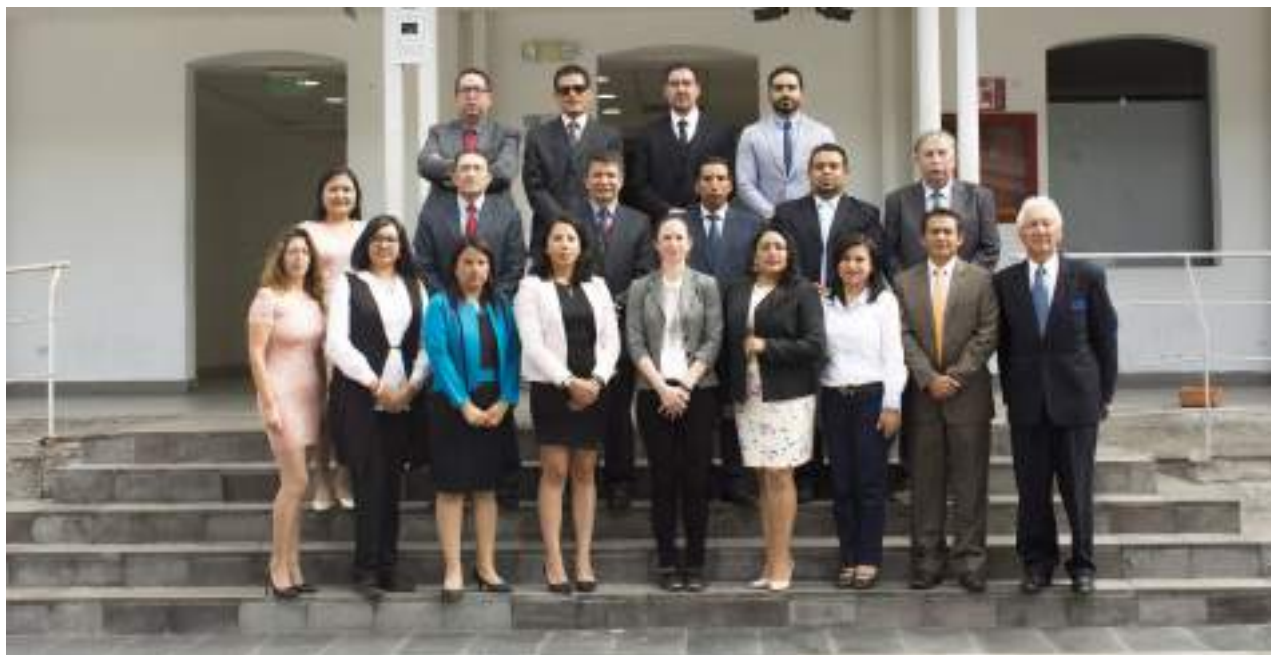
Foto 40 Equipo docente responsable de acreditación Unidad de Comunicación, 2019

por recopilar las evidencias que marca el modelo de evaluación, verificar que los procesos se cumplan de manera correcta y recomendar la implementación de medidas correctivas.