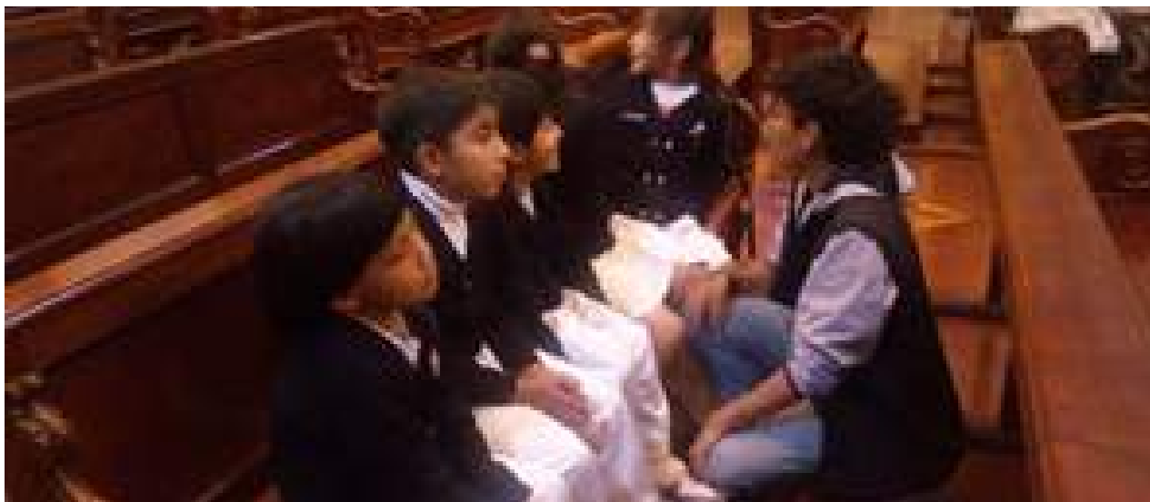
Foto 5 Estudiantes de Marketing compartiendo con estudiantes de educación básica Unidad de comunicación, 2019

Los estudiantes del Yavirac no se forman solo en competencias profesionales, también en empatía, solidaridad y cooperación con la sociedad, en este sentido se dio paso al proyecto compartiendo con los peques, cuyo objetivo se enfocaba en dar a conocer a los más pequeños