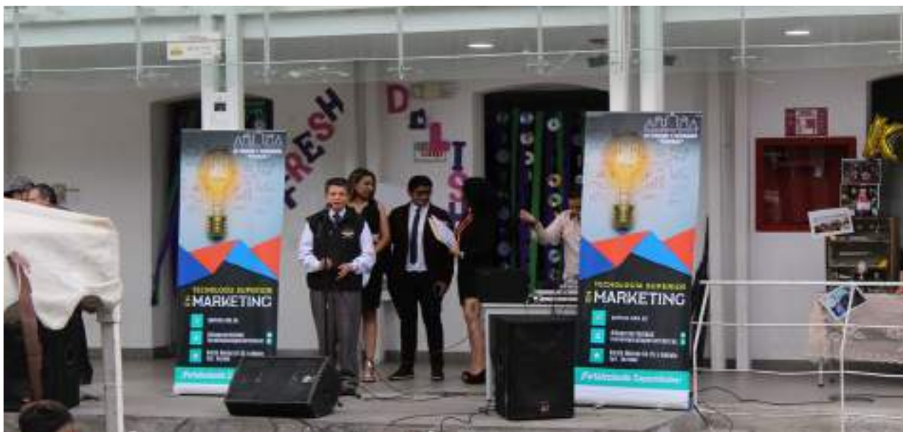
Foto 25 Segundo Cros Marketing Yavirac Unidad de Comunicación, 2019

Es el escenario perfecto para que los estudiantes de la carrera de Tecnología en Marketing puedan presentar sus proyectos, ideas y aplicar todos los conocimientos adquiridos dentro de las aulas. En su segunda edición los estudiantes prepararon nuevos proyectos que obtuvieron reacciones positivas de la comunidad educativa.