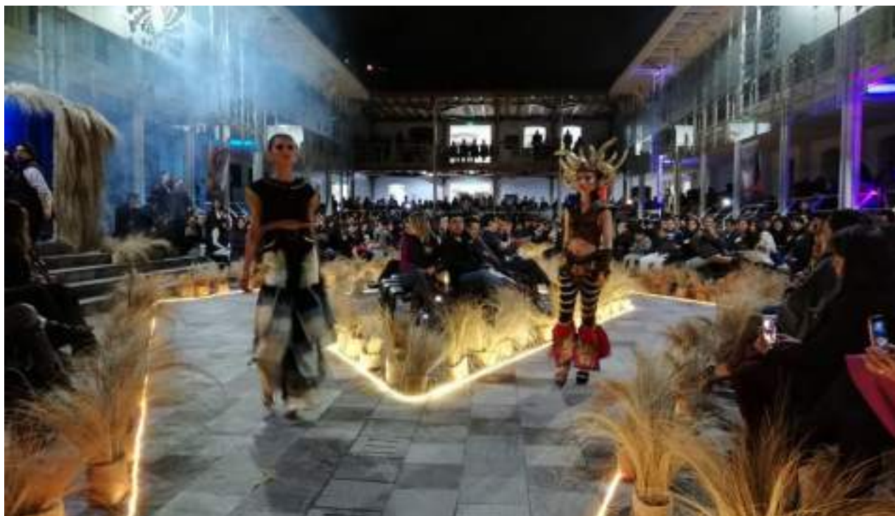
Foto 16 Escenario Gala Cultural Apachita